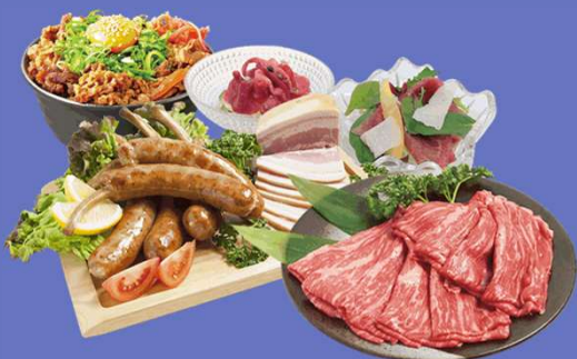
弊社取扱の食肉製品